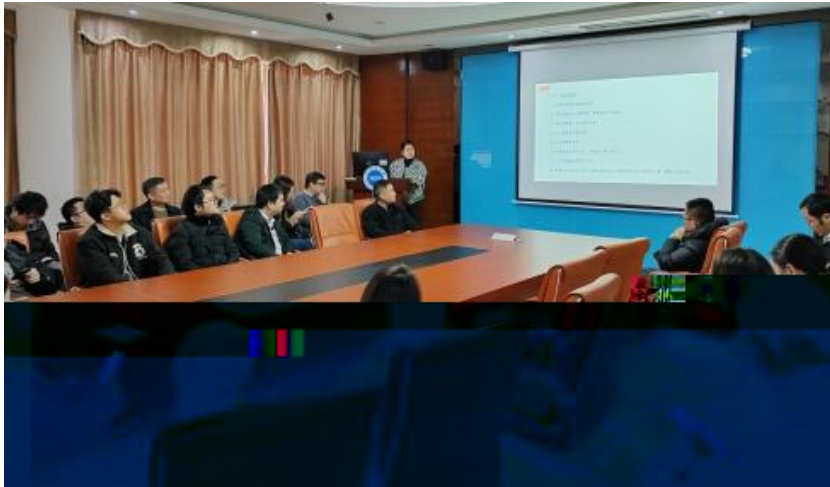
图 员工专业技能培训

，公 促 发 和 才 方 得 成 。 过 创 的 和 ， 不 动 公 的 持 成长， 工 供 的发 机会。 过 供多 化的 和发 ， “ 队 共 ” 等 活动 ( )， 帮 工 ( 技 和管 ； 并 的 和 规划， 工的 合 和 ， 包 导 发 计划、技 技 及 部 等， 地促 工的 方 发 。