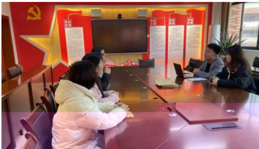
图 校企开展学术研讨项目交流会议

公 高度 队的 ，充分 到 和 的关 ，对 高 和 关 的 。此公 供 ，包 更 、 方法 及 导 发 程，并 持 丰富 的 家 过 、 会和 际案 ， 队 分 的 和 。 常 地 活动， 包 参加 会 、 等 ， 促 活 的 分 ， ， 并 的 队 ( )。